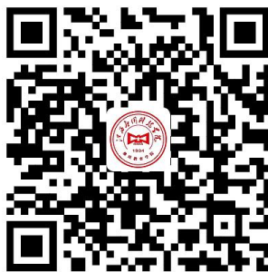
继续教育学院公众号